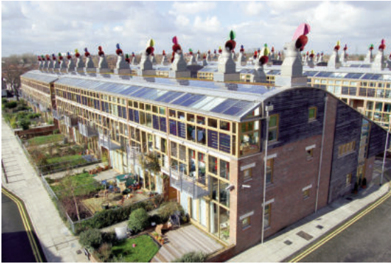
Làng sinh thái BedZED (ngoại ô London, Anh)

ở các thành phố, cũng như tâm lý tiêu dùng của cư dân đô thị, việc nghiên cứu các giải pháp nhằm thiết kế môi trường đô thị bền vững sinh thái là đặc biệt cấp thiết.