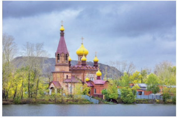
Satka - đô thị lịch sử xinh đẹp tới nay vẫn bảo toàn bản sắc

Tuy nhiên, không có nghĩa là hiện nay, một nhà máy hoàn toàn có thể đưa ra khỏi đời sống của một đô thị nhỏ, hay nói cách khác - các đô thị nhỏ khó có thể tồn tại mà không có cốt lõi sản xuất bền vững. Phi công nghiệp hóa không bảo đảm việc chuyển đổi sang nền kinh tế hậu công nghiệp kỳ diệu ở một thành phố Nga nhỏ bé. Một khu vực công nghiệp bền vững là chìa khóa của sức sống và sự phát triển bền vững. Hơn nữa, chính doanh nghiệp địa phương dưới mọi hình thức là tác nhân quan trọng nhất của những thay đổi và đa dạng hóa nền kinh tế. Việc tái cấu trúc các nhà máy trước đây cho