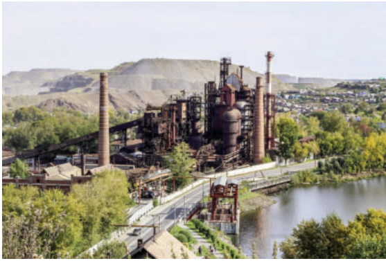
Satka - đô thị công nghiệp nằm ở trung tâm khai khoáng Nam Ural (Nga)

Các chương trình hỗ trợ các đô thị nhỏ của Nga hiện nay có tính đến vai trò của các đô thị này trong đời sống đất nước. Sự hỗ trợ này là hoàn toàn cần thiết. Bên cạnh đó, các yêu cầu đối với các thị trấn và đô thị nhỏ về việc vận hành và tìm kiếm các xu hướng, nguồn lực mới để phát triển ngày một cao hơn. Bài viết về kinh nghiệm của đô thị nhỏ Satka (vùng Chelyabinsk) theo định hướng này.