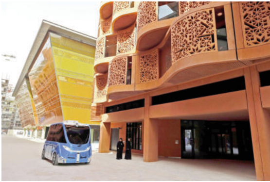
Dự án Masdar (UAE) - thành phố “zero carbon”

trên thực tế không hề hấp dẫn người giàu phương Tây. Do đó, nhiều người dân địa phương rời đi, trong khi dòng người nước ngoài giàu có không đủ để lấp đầy thành phố.