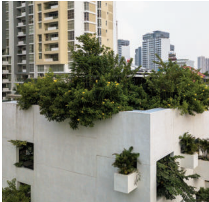
Sky House - ngôi nhà “mở” và “thở” giữa Tp. Hồ Chí Minh

dụng phục hồi sức khỏe con người. Các yếu tố tự nhiên cần được đưa vào không gian bên trong nhà để cải thiện sức khỏe tổng thể, bao gồm không khí, ánh sáng, sàn nhà, không gian xanh và thiết kế đồ nội thất ở vị trí phù hợp để cải thiện trải nghiệm trong nhà.