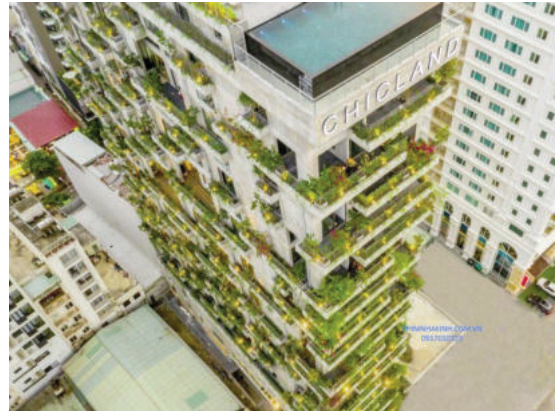
CHICLAND Hotel (Đà Nẵng)

- Ánh sáng động và khuếch tán: lợi ích từ