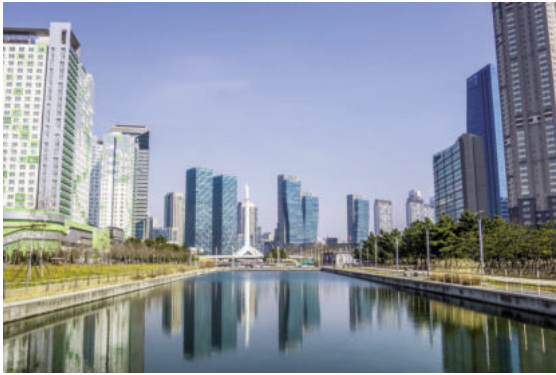
Thành phố thông minh Songdo (Hàn Quốc) thụ nước và 25% nhu cầu tiêu thụ điện.

Năm 2006, khu dân cư Christie Walk rộng 2000 m 2 được xây dựng tại Adelaide (Úc), với 27 ngôi nhà tư nhân, được chia thành các biệt thự, nhà phố và căn hộ. Khu được hình thành thông qua các tổ chức phi lợi nhuận - Wirranendi (hợp tác xã của các chủ sở hữu đất tại Christie Walk), nhà phát triển Ecocity, công ty kiến trúc thương mại Ecopolis Architects. Các ngôi nhà được xây dựng bằng vật liệu sinh thái - bê tông khí và khối rơm nén. Các nhà có tuổi thọ 100 năm thay vì 25 năm theo tiêu chuẩn của Úc, được sưởi ấm hoàn toàn bằng hệ thống thụ động. Nước thải được chứa trong hai bể chứa 20 nghìn lít và được tái sử dụng trong các toilet và hệ thống tưới tiêu.