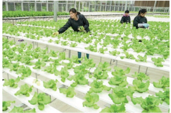
Sản xuất nông nghiệp vùng ven đô Trung Quốc

Các nhà nghiên cứu, các tổ chức chuyên ngành đã đưa ra nhiều mô hình lý thuyết cho những khu vực nông thôn ven đô trong quá trình đô thị hóa: mô hình Desakota được áp dụng rộng rãi ở Trung Quốc và Indonesia; mô hình “vùng đô thị mở rộng” chủ yếu được áp dụng ở Hồng Kông và Singapore; mô hình “thành phố vùng”, “vùng tương tác ven đô” được áp dụng chủ yếu ở châu Âu. Các mô hình này về cơ bản đều có các tiêu chí chung: đề cao vai trò của nông nghiệp vùng ven đô, đề xuất phát triển nông nghiệp tại các vùng ven theo hướng nông nghiệp tập trung, ứng dụng các công nghệ cao mang tính sinh thái; phi tập trung đô thị hóa; kết hợp hài hòa giữa đô thị và nông thôn. Các mô hình góp phần cung ứng nguồn lương thực, thực phẩm tươi sống tại chỗ cho các đô thị; tạo việc làm và thu nhập cho một bộ phận dân cư đô thị; góp phần quản lý bền vững