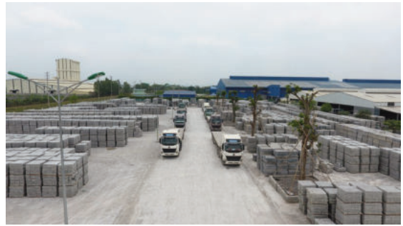
Dưỡng hộ gạch bê tông tại bãi chứa của nhà máy gạch Khang Minh

Mô hình 1: sau khi tạo hình, gạch được bảo dưỡng và dưỡng hộ nhiệt ẩm trong hầm có tường, trần bao che, cách nhiệt trong thời gian khoảng 20 - 24 giờ; sau đó được dỡ khỏi palet xếp thành kiện, phun nước và xếp thành dãy ngoài bãi chứa sản phẩm. Tại đây, gạch tiếp tục được dưỡng ẩm bằng cách phun nước một thời gian. Có thể sử dụng một trong hai dạng nhiệt từ hơi nước: hơi nước nhận nhiệt từ ánh sáng mặt trời nhờ hệ thống kính bẫy nhiệt hay được gọi là dưỡng hộ nhiệt ẩm gạch bê tông sử dụng năng lượng mặt trời; hơi nước được cấp vào hầm từ nồi hơi sử dụng buồng đốt dùng